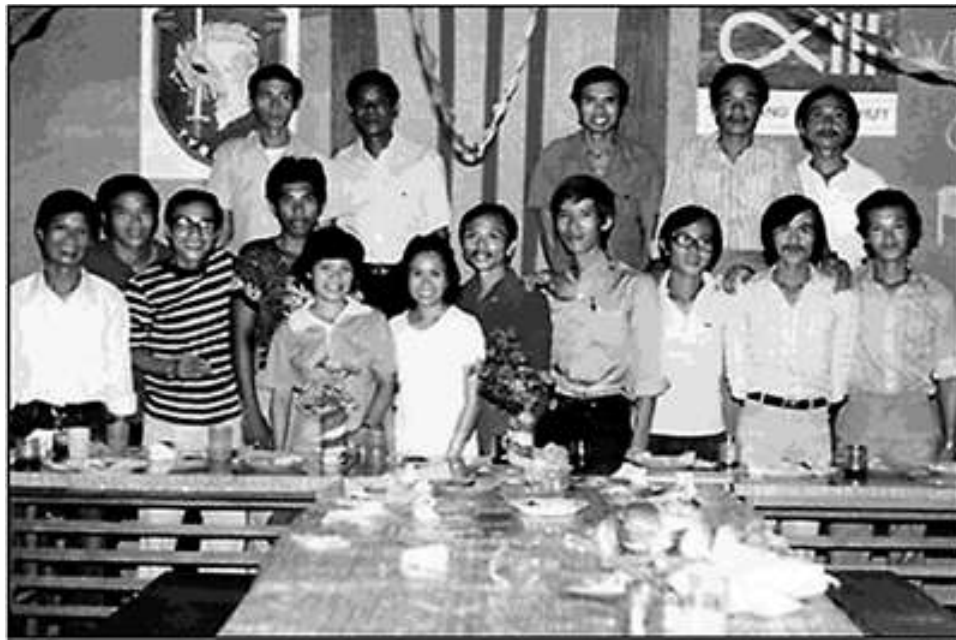
Tại Trại Phi