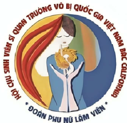
Phù Hiệu Đoàn Phụ Nữ Lâm Viên Bắc California

Đoàn Kỳ có nền xanh da trời nhạt cùng màu với phù hiệu, trên mặt mang phù hiệu Đoàn PNLV với hai giải Cờ Vàng Ba Sọc Đỏ - Quốc Kỳ VNCH.