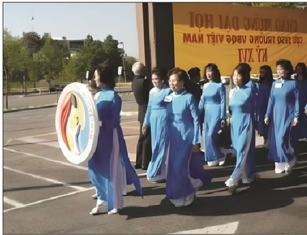
Phù Hiệu và Đoàn Phụ Nữ Lâm Viên Bắc California trong Đại Hội VB XVI

Nền xanh da trời, có hình người Phụ Nữ Việt Nam, với đôi tay nâng huy hiệu TVBQGVN một cách trân trọng.