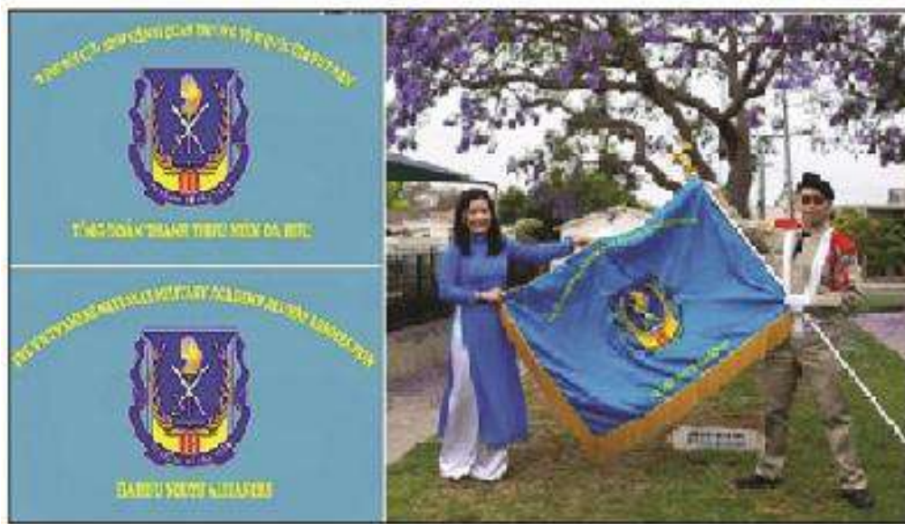
Hiệu Kỳ Tổng Đoàn TTNDH - (Mặt 1: Việt Ngữ, Mặt 2: Anh Ngữ)

- Màu vàng của tua viền, chữ và màu của nền cờ VNCH: Mọi việc làm của Tổng Đoàn TTNDH đều được dựa trên tính nhân bản của thể chế này và tượng trưng cho sự trẻ trung, lòng hăng say, nhiệt huyết của lớp trẻ.