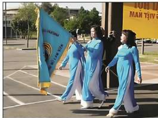
Đoàn Kỳ Phụ Nữ Lâm Viên Bắc California

Đoàn Kỳ có nền xanh da trời nhạt cùng màu với phù hiệu, trên mặt mang phù hiệu Đoàn PNLV với hai giải Cờ Vàng Ba Sọc Đỏ - Quốc Kỳ VNCH.