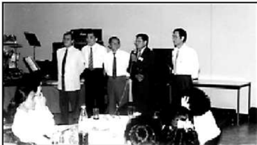
Trình diện Tân Ban Chấp Hành LH/CSVSQ/VB Âu Châu