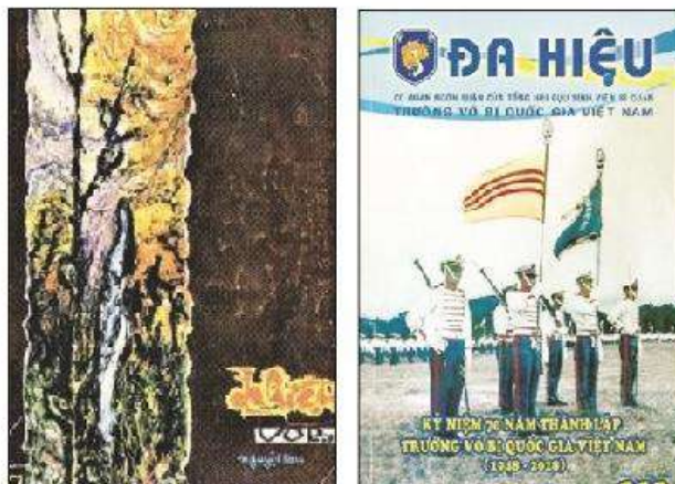
Nguyệt San Đa Hiệu - 1960 Đặc San Đa Hiệu - 2018