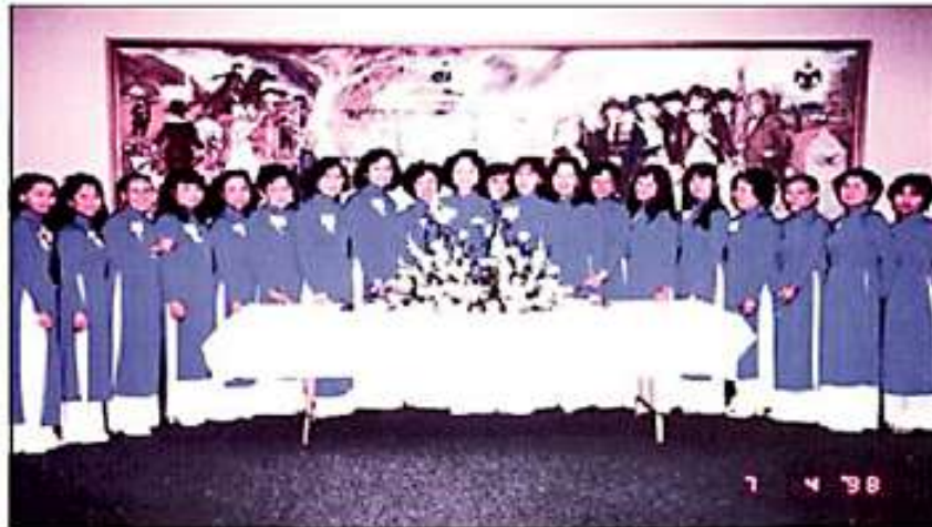
Ban Tiếp Tân Đại Hội VB XI trong những tà áo dài Màu Thiên Thanh

Hội Võ Bị Bắc California được tổ chức ngày 25/05/1980, với danh xưng Chi Hội Ái Hữu CSVSQ/TVBQG VN Bắc California, đã tạo cơ hội cho các phu nhân đóng góp nhiều hơn nữa trong việc tổ chức các kỳ họp mặt thường niên, tổ chức các buổi picnic mùa hè cũng như những ngày lễ hội Tất Niên và Tân Niên. Đặc biệt, trong kỳ Đại Hội Võ Bị Toàn Cầu XI vào tháng 07/1998, trên 30 phu nhân của các CSVSQ Võ Bị các khóa đã thành lập Ban Tiếp Tân để hỗ trợ