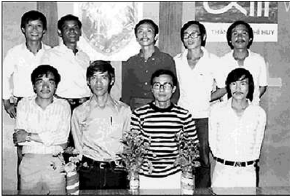
Tại vùng 6 Philippine - Ngày 22/06/1982