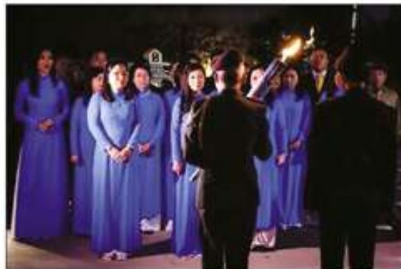
Tổng Hội CSVSQ/TVBQGVN trao Được Thiêng cho Tổng Đoàn TTNDH - Đại Hội XXI - 2018 -

Cầu mong hồn thiêng sông núi và anh hùng tử sĩ sẽ dắt dìu thế hệ hậu duệ chân cứng đá mềm hoàn thành sứ mệnh mà cha ông đã trao truyền.