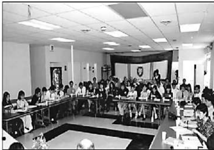
Đại Hội TTNDH lần đầu tiên tại Fairfax, Virginia, Hoa Kỳ - Tháng 5/1999

Vào tháng 05/1999, lần đầu tiên các đoàn và đại diện của các địa phương đã tụ hội về Thủ Đô Hoa Thịnh Đốn (Fairfax, VA) để thành lập Tổng Đoàn TTNDH, nhằm nối kết TTNDH trên toàn thế giới.